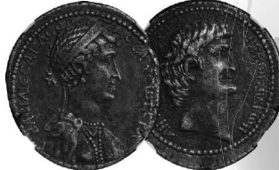
2022年7月16日 シリア テトラドラクマ銀貨 36BC クレオパトラ・アントニウス共同統治期 NGC-Ch XF 落札 1000万円 +BP