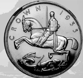
2022年1月16日 イギリス ジョージ5世 試作クラウン金貨 1935 NGC-PF66 Ultra Cameo 落札 1900万円 +BP