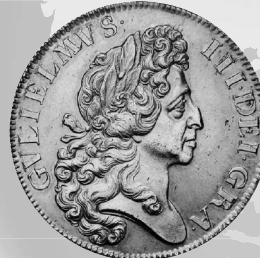
2022年1月16日 イギリス ウィリアム3世 5ギニー金貨 1701 PCGS-MS63 落札 3100万円 +BP