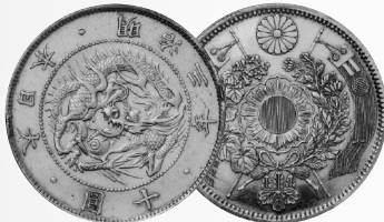
日本近代貨幣史上に燦然と輝くウルトラレア 試作旧十圓金貨 "明治3年" 日本貨幣カタログ掲載品 PCGS-SP61