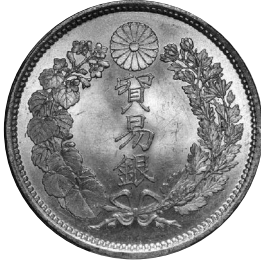
2022年1月15日 貿易銀 明治8年 "大桐" PCGS-MS64 落札 1500万円 +BP