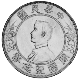
2022年7月16日 中華民国 孫文開国記念金幣 (1927) NGC-MS66 落札 1700万円 +BP