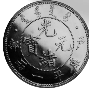
2022年10月15日 後鑄 光緒元寶 庫平一両 金幣 戸部 光緒29年 NGC-PF65 落札 1250万円 +BP