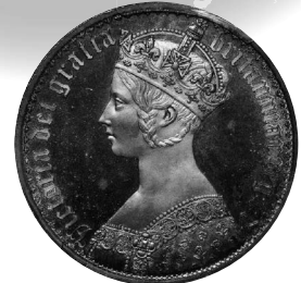
2022年10月16日 イギリス ヴィクトリア ゴチッククラウン 1847 UNDECIMO PCGS-PR64+ DCAM 落札 1450万円 +BP